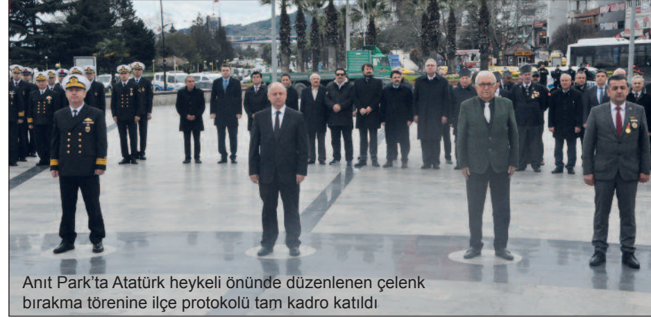
Anıt Park'ta Atatürk heykeli önünde düzenlenen çelenk bırakma törenine ilçe protokolü tam kadro katıldı

Türk tarihinin en büyük zaferleri arasında yer alan 18 Mart Çanakkale Deniz Zaferi'nin 105. yıl dönümü dolayısıyla Kdz. Ereğli'de tören düzenlendi.